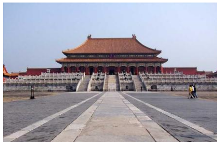
图7 太和殿，清朝皇帝治国理政的场所