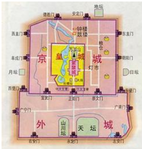
图一 明代北京城平面图