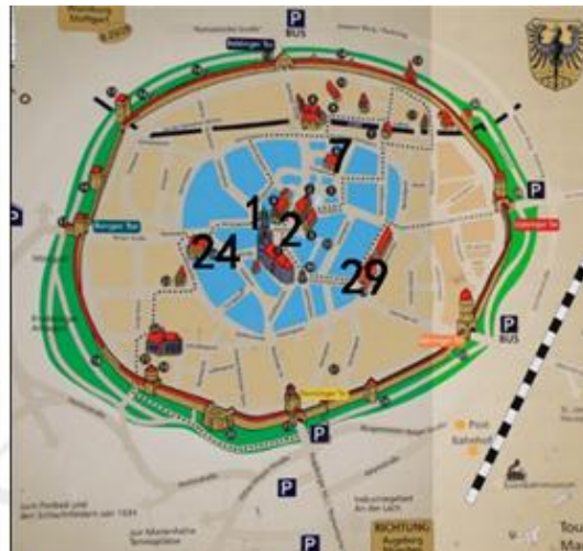
图二 德国诺林根城市平面图

说明：该城建于9世纪，约1217年成为德意志自由城市。图中1处为教堂及教堂广场；2处为市政厅；7处为制革作坊；24处为盐、酒仓及粮仓；29处为玉米贸易点。