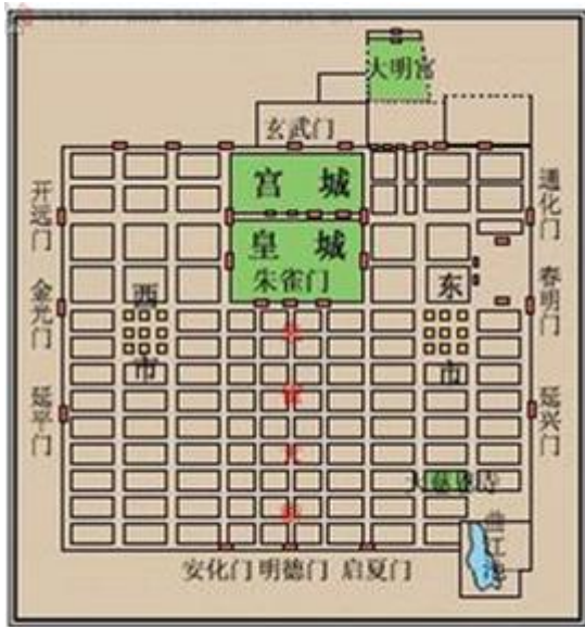
唐朝长安城平面图

2. (2016·湖北省八市 2014 年高三 3 月联考·41) (12 分) 阅读材料，完成下列要求。古代都城是国家的政治、经济、文化中心，而形成的都城文明堪称中华文明的缩影。