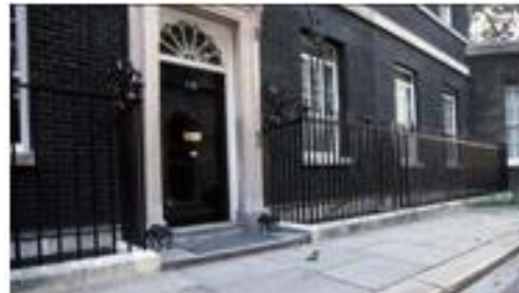
图8 白金汉宫（左）和唐宁街10号（右）， 自18世纪中期至今分别为英国王宫和首相官邸